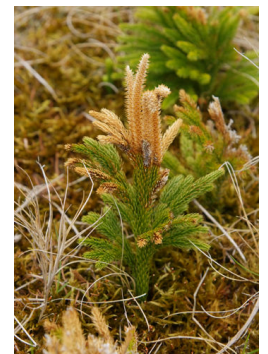
すし屋のネタケースで おなじみ、マンネンスギ

などの作物です。まだどれほど採算がとれるかなどはわかりませんが、ためしに作ってみたいというかたがいらっしゃいましたら、えんがわ喫茶までお問い合わせください。また、ほかにも「こんなものを作ってみるといいぞ」という作物がありましたら、お話をお聞かせください。お待ちしております。