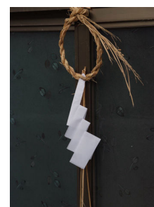
おなじみの「輪じめ」

【日時】11月30日(火) 18:30~20:00 【場所】湯本集会所 参加無料