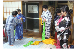
↑ゆかた教室のようす

【持ち物】「あわせ」一式 【参加費】1きもち 【申込み】えんがわ喫茶まで TELまたは直接 【定員】15名 【担当】星あき子